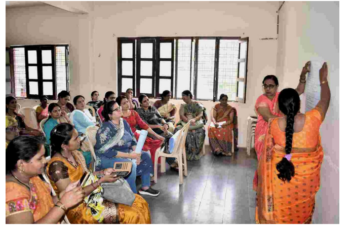
ಕಾರ್ಯಾಗಾರದಲ್ಲಿ ಚಟುವಟಿಕೆಗಳು ಹಾಗೂ ಚರ್ಚೆಯಲ್ಲಿರುವ ಶಿಕ್ಷಕಿಯರು